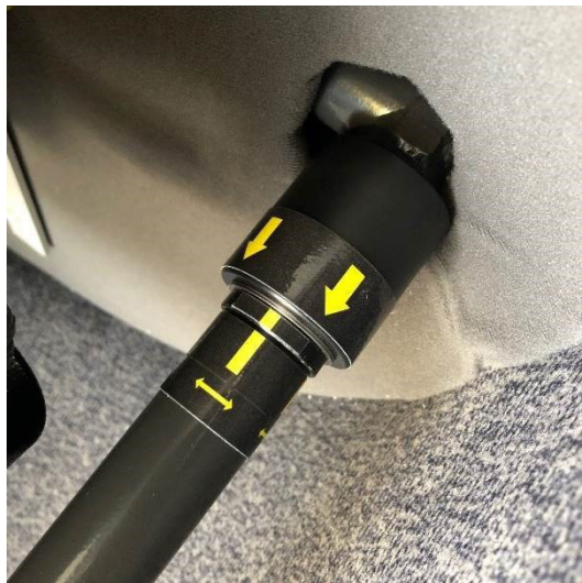
Figure 3 : Marquage sur la commande de pas collectif en place gauche après application du SB

À la suite de l'accident, le constructeur de l'hélicoptère a édité le 6 décembre 2019 un bulletin de service (SB 19-015 A) à destination des exploitants. Il vise à mettre en place un marquage (voir figure 3) au niveau de l'assemblage de la commande de pas collectif en place gauche permettant de détecter visuellement un montage incorrect, en complément de la procédure de montage décrite dans le manuel de vol.